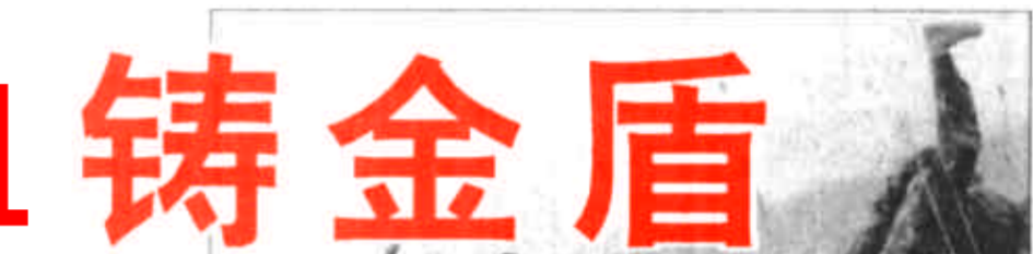
记全国优秀公安局利津县公安局

1997年8月20日，我市遭受特大风暴潮袭击。下午6时30分，干警们正准备吃晚饭，要求增援的通知从抗洪前线传来，局领导立即率干警100余人赶赴抗洪前线，全体干警不顾个人安危，英勇抗击风浪，确保了近千名被困群众及大量牲畜的安全。次日零时23分，带队领导得知在老河口以北偏东10华里处盐窝