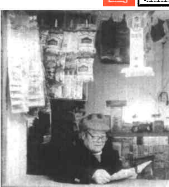
单身汉·大棚菜·摩托车